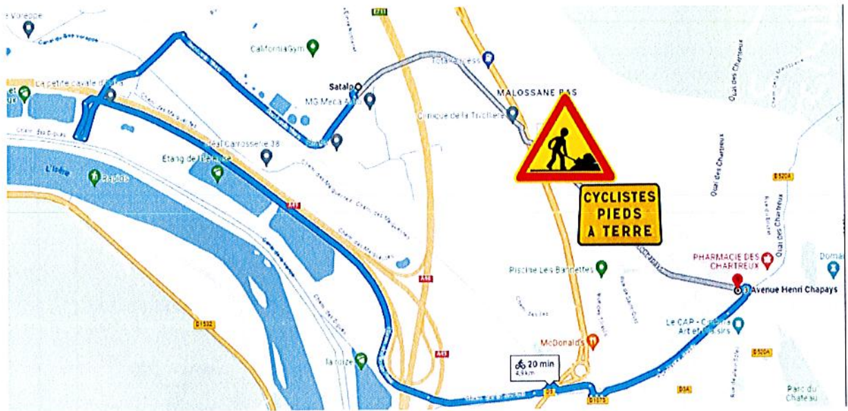
Plan de déviation cycles