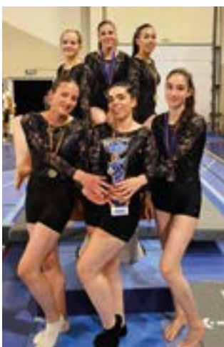
N3 (11/18 ans)