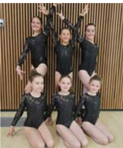
N6 (11/15 ans)

Le club cherche également un entraîneur qualifié afin de renforcer l'équipe d'encadrement.