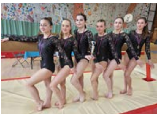
N5 (11/18 ans)