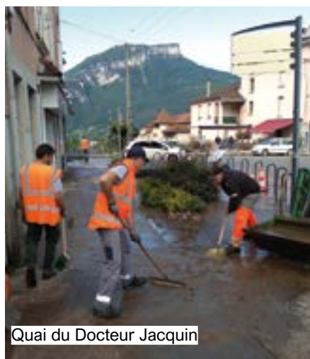
Quai du Docteur Jacquin