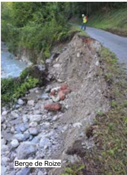
Berge de Roize