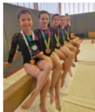
N7 (7/12 ans)

* Union Française des Oeuvres Laïques d'Éducation Physique