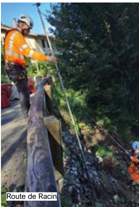
Route de Racin