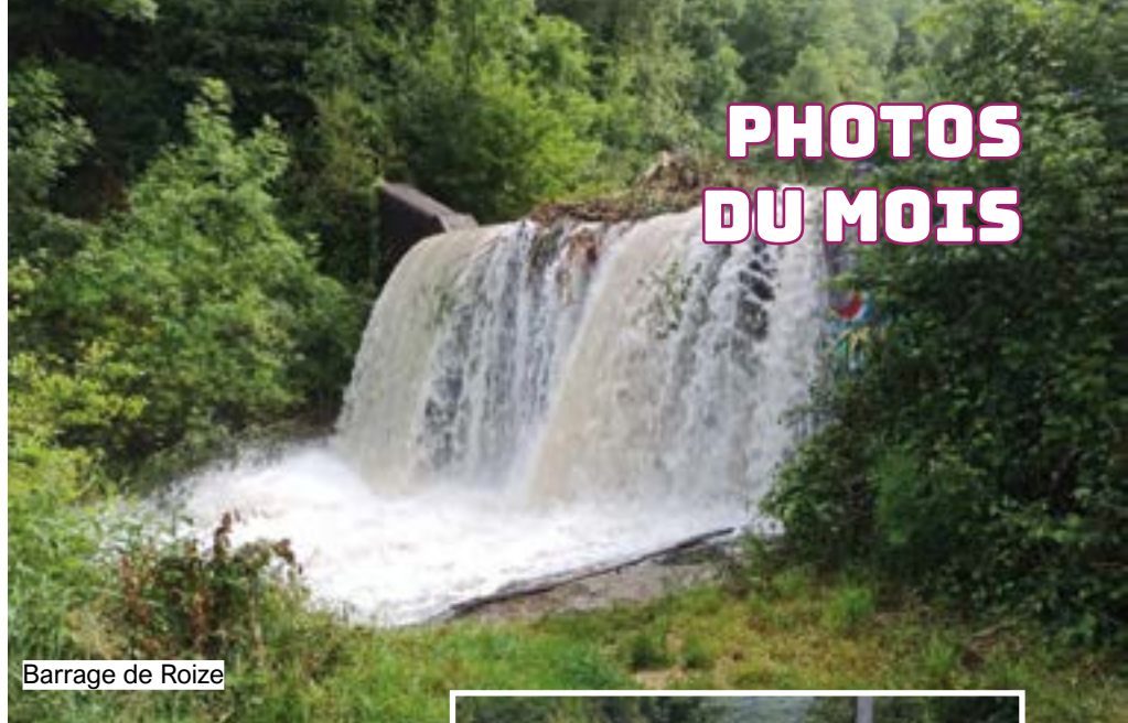
Barrage de Roize