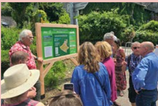
L'Espace Loisirs Orientation a été inauguré le 26 juin, en présence de son parrain, l'artiste voreppin Serge Papagalli.