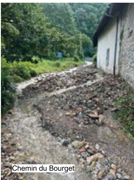
Chemin du Bourget