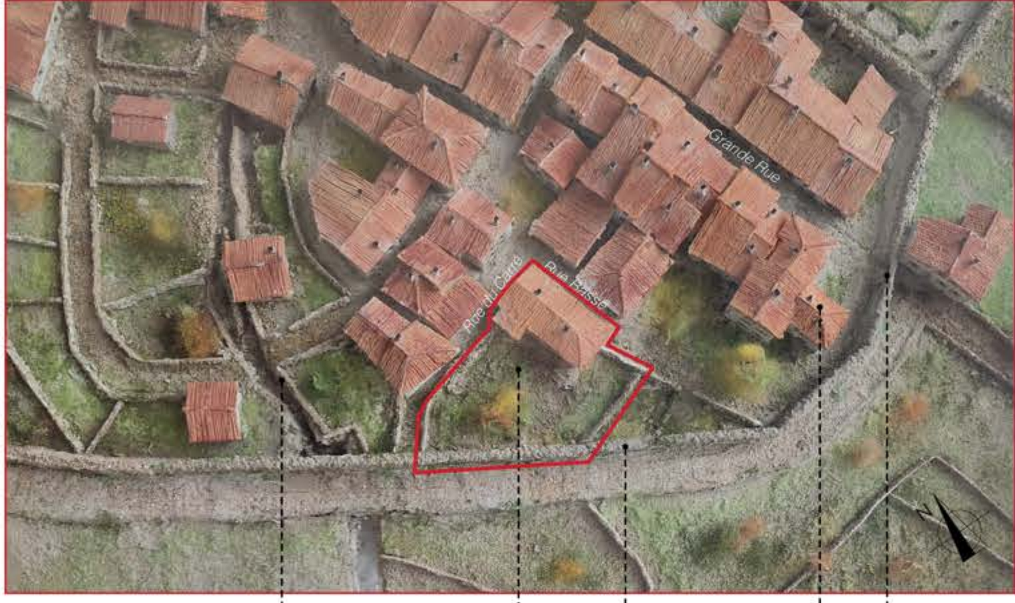
Maquette du bourg de Voreppe au 18 e siècle - Réalisée par AVIPAR (2000) - Voreppe

La construction du bâti actuel de l'îlot communal serait antérieure à 1750. L'actuelle Place Armand-Pugnot était à l'origine un grand jardin cultivé rattaché au bâti de l'îlot communal qui longeait la ligne de rempart.