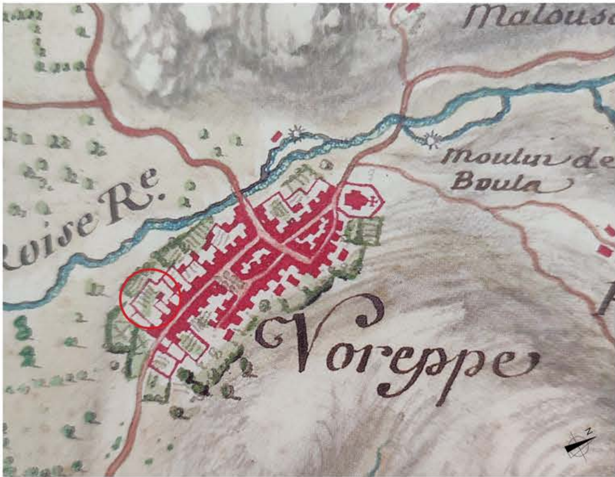
Extrait de la carte de la frontière du Dauphiné et de la Savoie vers 1711

Le bâti de l'îlot communal est un bâti ancien, c'est à dire construit avant 1948, selon des techniques, des savoir-faire et des matériaux dits traditionnels tels que la pierre et le bois. Sa typologie se rapproche plus de celle d'une maison rurale, ou d'une ferme que d'une maison de ville.