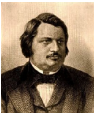
[7]Honoré de Balzac (1799 - 1850) [8]