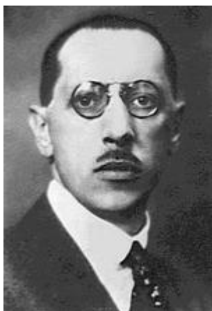
[9] Igor Stravinski (1882 - 1971). [10]

Musicien russe, il vécut quelque temps en tant qu'invité dans la villa de La Veronnière (citée dans Chronique de ma vie par Igor Stravinski).